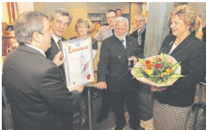
In diesem Jahr war die Landtagspräsidentin Birgit Diezel Ehren-gast und bekam den Ehrentitel „Birgit die Tapfere“ verliehen.

Am 15.01.2011 beging Weißensee mit einer Feierstunde im Rathaussaal zum 10. Mal den „Tag des Tapferen“. Wie seit 2001 üblich, erfolgte anschließend der Anstich eines 6,5 % Traditionsbieres, welches als Bockbier extra zum Tag des Tapferen von der Ratsbrauerei gebraut wurde.