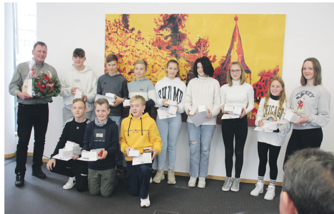
Die Volleyballerinnen und Volleyballer der WK4 vom „Oskar Gründler“-Gymnasium Gebesee sind stolz auf ihre Erfolge.

Es freute ihn besonders, dass die Teilnehmerzahlen bei den Wettkämpfen rund um „Jugend trainiert für Olympia“ wieder steigend sind. Besonders aktiv seien die drei Gymnasien im Landkreis sowie die Staatliche Gemeinschaftsschule „Albert Einstein“ Sömmerda. Das sei das Ergebnis des Engagements der dortigen Fachschulleiter Sport, so der Landrat. Mit tollen Leistungen zählten es ihnen vor allem die Volleyballerinnen und Volleyballer des „Oskar Gründler“-Gymnasiums Gebesee zurück, die sowohl auf Landes- als auch auf Bundesebene erfolgreich waren.