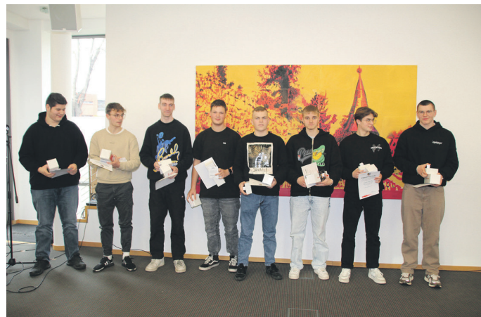
Mit ihrem 3. Platz im Landesfinale Handball der WK 2 waren die Jungen vom „Albert Schweitzer“-Gymnasium Sömmerda erfolgreich.

An den über 30 Kreisfinals nahmen ca. 2.200 Schülerinnen und Schüler teil. Die teilnehmerstärksten waren der Crosslauf mit fast 700 Aktiven, die Fußballwettbewerbe mit ca. 200 Kickern, die Ballsportarten Volleyball, Basketball und Handball mit rund 700 Teilnehmern sowie die Grundschulwettbewerbe im Schwimmen, Leichtathletik und Zweifelderball mit rund 600 Mädchen und Jungen.