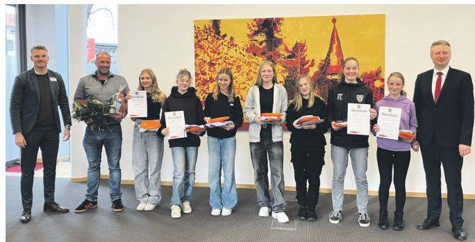
Die Sportlerinnen des Gymnasiums Gebesee wurden für den ersten Platz im Landesfinale Fußball der WK IV Mädchen geehrt.

Landrat Christian Karl richtete in seiner Rede den Fokus auf die wichtige Rolle der sportlichen Vorbilder, die Begeisterung und Leidenschaft für den Sport wecken und zugleich Werte vermitteln, die ein ganzes Leben lang tragen: Teamgeist, Solidarität, Ehrgeiz, Verantwortungsbewusstsein.