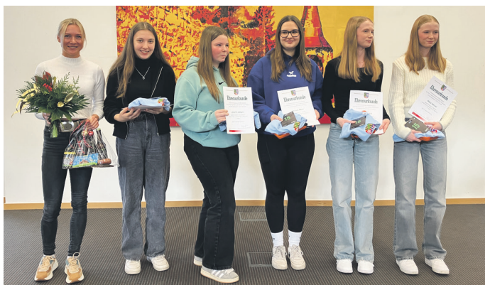
Die Mannschaft der Salzmannschule Sömmerda belegte den dritten Platz im Landesfinale Volleyball WK III Mädchen.