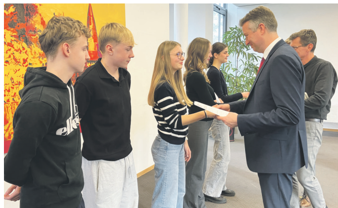
Auch die Gebeseer Beachvolleyballer waren im Schuljahr 2023/2024 erfolgreich.

„Auch ihr steckt diese Begeisterung für den Sport, sonst hätten ihr diese Erfolge kaum feiern können“, hob der Landrat hervor und schloss in seinen Dank an die Lehrerschaft auch die Verantwortlichen des Öffentlichen Personennahverkehrs für die Beförderung zu den Wettkämpfen, den Mitarbeitern des Kreissportbunds Sömmerda und die Sparkasse Mittelthüringen ein. Sie alle gemeinsam sorgten erst dafür, dass überregionale und schulsportliche Wettkämpfe in dieser Weise durchgeführt werden könnten.