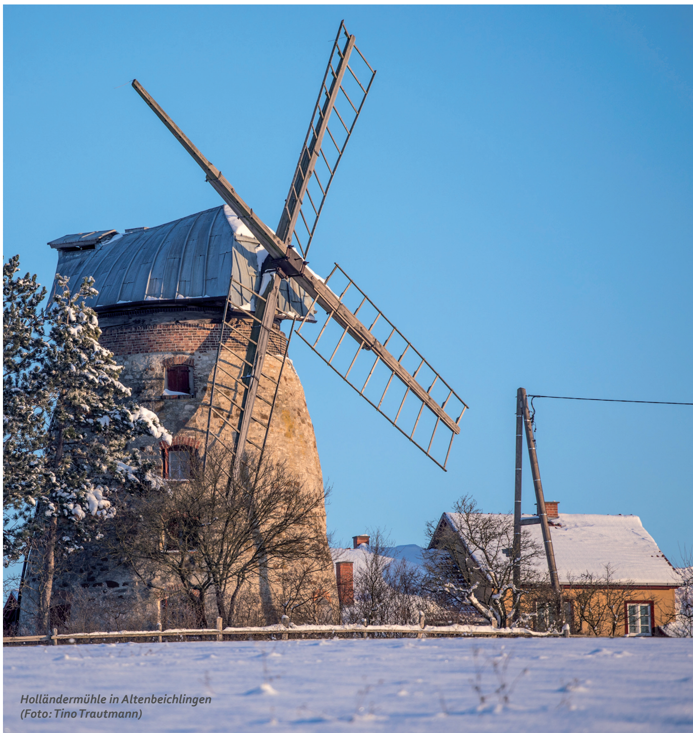
Holländermühle in Altenbeichlingen