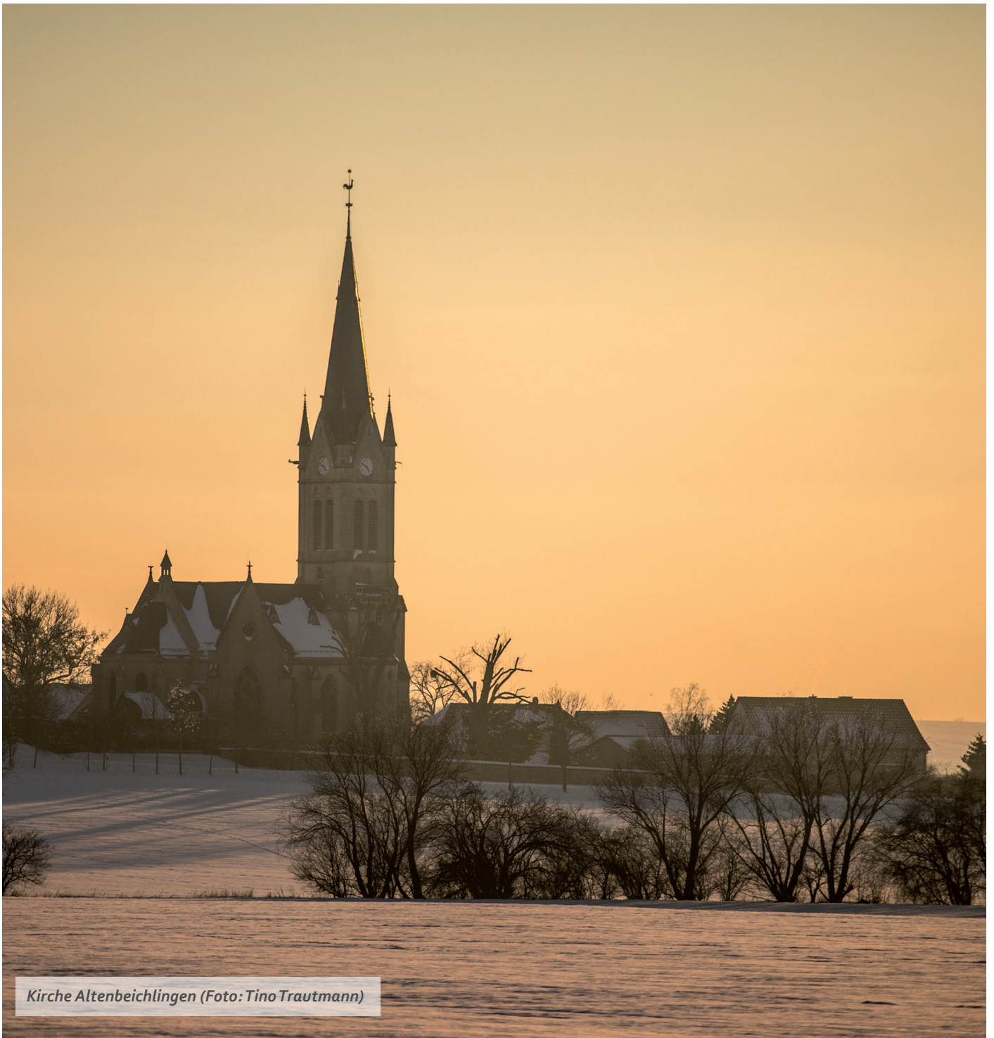
Kirche Altenbeichlingen