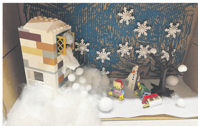
Diese Märchenkiste widmet sich auf kreative Weise „Frau Holle“.

Die guten und bösen Märchenfiguren wurden eingehend kennengelernt, ebenso wie wichtige verzauberte Gegenstände. Zudem wurde täglich ein neues Märchen vorgestellt, um zu wahren Experten zu werden. Der Ausflug endete mit einer spannenden Entscheidung: Jedes Kind wählte sein Lieblingsmärchen aus und bastelte dazu eine Kiste. So entstanden zahlreiche kreative Märchenprojekte, die den Zauberwald direkt in den Klassenraum holten.