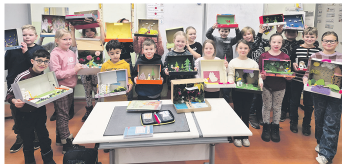
Endlich geschafft: Viel Kreativität steckt in den Märchenkisten der 3a.

Die Klasse 3a hat sich aufgemacht ins zauberhafte Land der Märchen. Auf ihrem Weg begegneten sie den berühmten Märchenschreibern Grimm und Andersen sowie ihren zahlreichen, faszinierenden Geschichten. Nachdem sie „Rotkäppchen“ und „Des Kaisers neue Kleider“ genauer unter die Lupe genommen hatten, analysierten sie, was ein typisches Märchen ausmacht und welche Dinge im Zauberwald nicht zu finden sind.