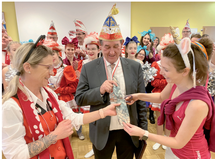
Auch in diesem Jahr musste die Dienstkrawatte des Landrats dran glauben. Es war eben Weiberfastnacht.