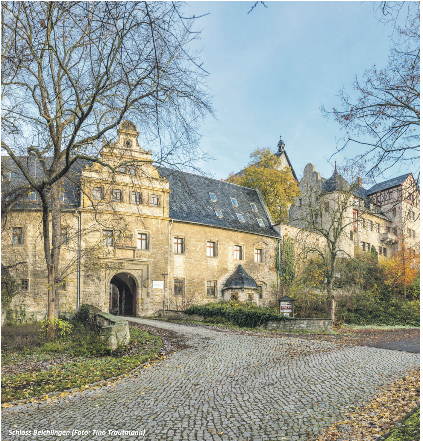
Schloss Beichlingen