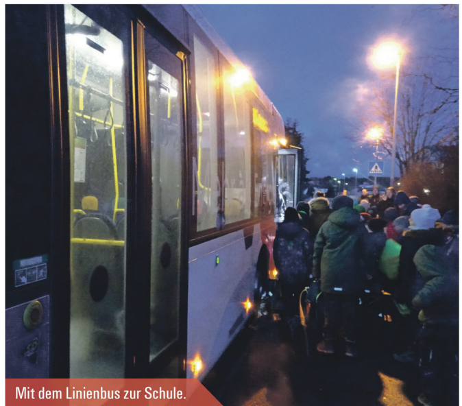
Mit dem Linienbus zur Schule.

» Der Fahrplan ist immer ein Kompromiss. «