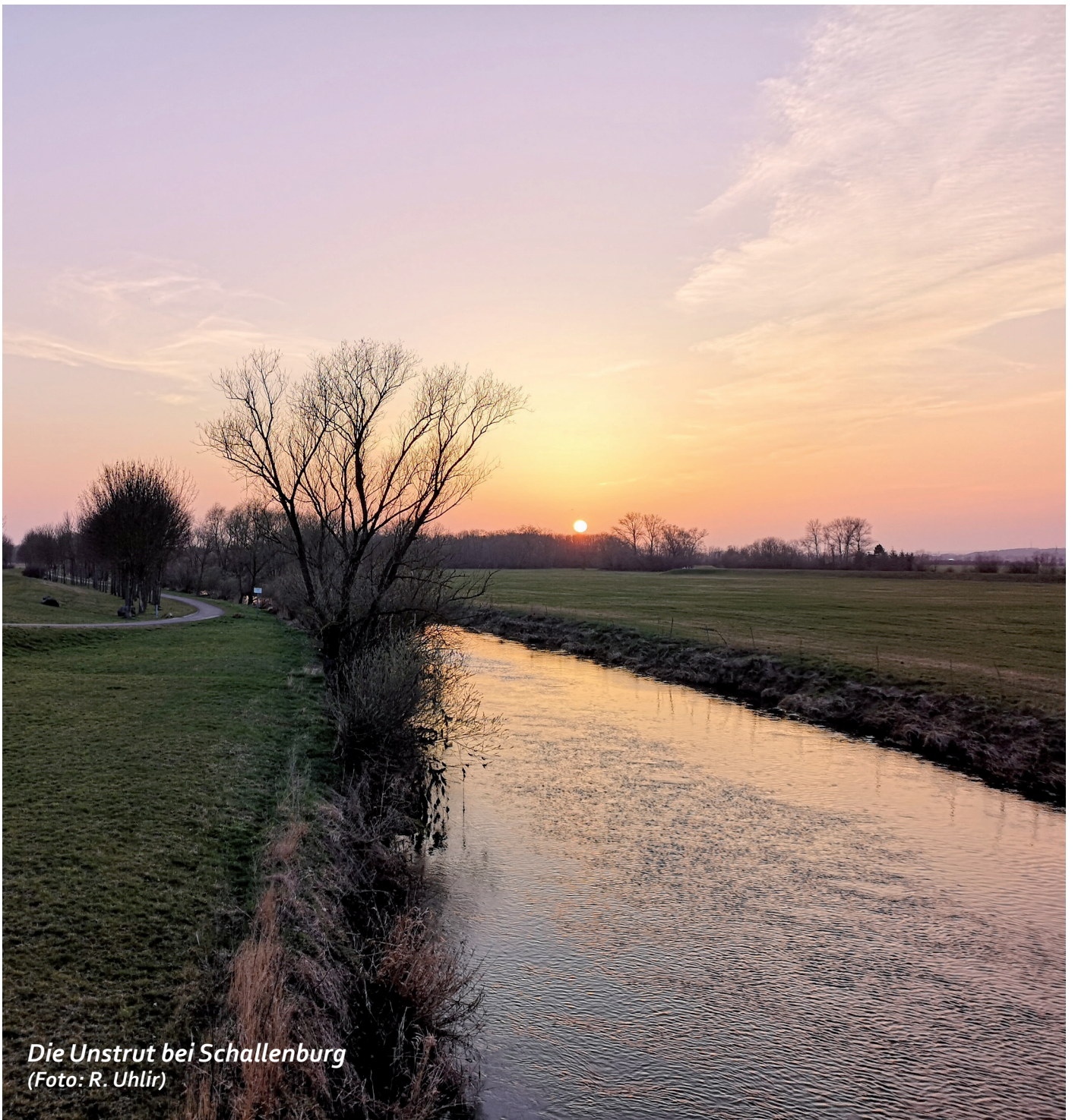
Die Unstrut bei Schallenburg