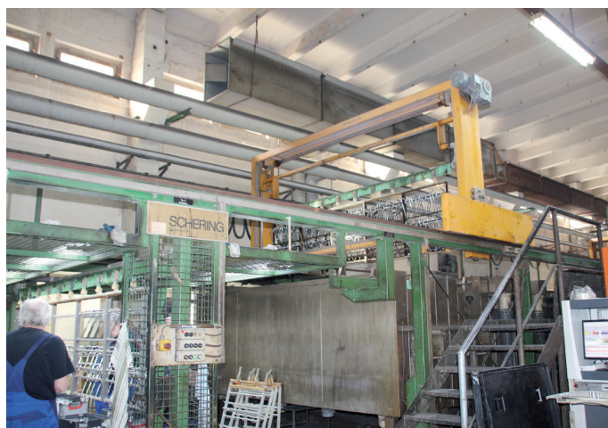
Das Unternehmen hat die Weichen längst auf Nachhaltigkeit gestellt und in den Bau einer neuen Chrom III-Anlage sowie den Umbau einer vorhandenen Anlage investiert.

Als funktionierende Lösung hat mbw die Qualifizierung von fachfremdem Mitarbeitern für sich entdeckt. Auch ausländische Mitarbeiter hätten so schon Beschäftigung im Betrieb gefunden.