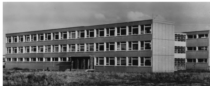
Pressefoto von Peter Radtke, Sömmerda

die einen Einblick in die Schulgeschichte von 1965 bis heute gibt. Die Ausstellung zeigt zahlreiche historische und aktuelle Aufnahmen aus sechs Jahrzehnten Schulleben und lässt Erinnerungen an vergangene Zeiten lebendig werden.