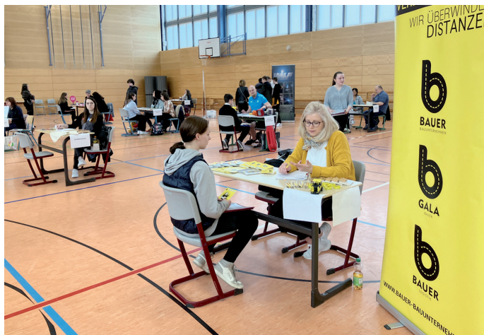
Die Schüler hatten sich vorbereitet und durften Favoriten wählen, in denen sie ihren Praxistag absolvieren möchten.

Vor dem Hintergrund des wachsenden Fachkräftemangels versprechen sich beide Seiten Vorteile von diesem Projekt. Die Firmen lernen die Schülerinnen und Schüler über eine längere Zeit kennen und können so potentielle Auszubildende gewinnen. Die Schüler haben die Möglichkeit, intensiv Erfahrungen zu sammeln, die ihnen bei ihrer Entscheidung für ihren künftigen Berufsweg hilfreich sind. In das Projekt sind Firmen und Institutionen einbezogen, die bereits Erfahrungen im Bereich Ausbildung haben.