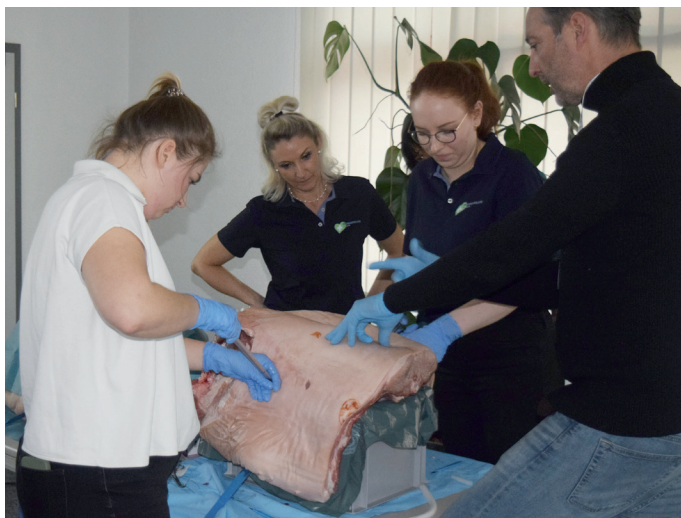
An verschiedenen Stationen gab es für die Teilnehmer die Möglichkeit zu intensivem Praxistraining in Kleingruppen.

Neben altbewährten Methoden der Akutmedizin wurden auch neue Techniken und Herangehensweisen an bestimmte Krankheitsbilder aufgezeigt, um so ein noch breiteres Spektrum an Behandlungsmöglichkeiten abzubilden.