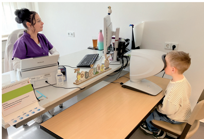
Auch ein Sehtest ist Teil des Untersuchungsprogramms.

Kinder im Bundesmaßstab vergleichbar macht. Das gesunde, ausgeschlafene Vorschulkind sollte gemeinsam mit einem Sorgeberechtigten zur Schuleingangsuntersuchung erscheinen, nur in Ausnahmefällen mit einem zusätzlichen Betreuer oder Sprachmittler. Wenn das Kind eine Brille trägt, so ist diese und der Brillenpass mitzubringen.