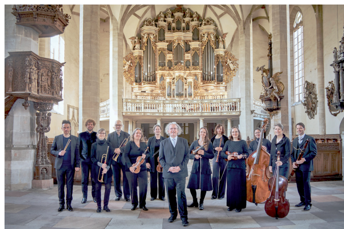
Die Instrumentalisten der Merseburger Hofmusik im Jahr 2021