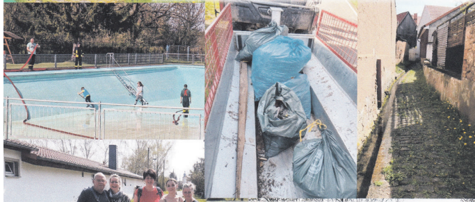
KCC, MGV, KSV, FFW, SSG, Laufgruppe und Helfer waren unterwegs, um Müll zu sammeln und haben ihre Objekte auf Vordermann gebracht.