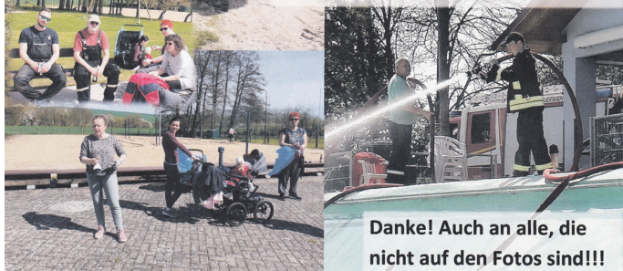
Danke! Auch an alle, die nicht auf den Fotos sind!!!

Das Wetter am 22. April 2023 hatten wir scheinbar verdient. Am bisher schönsten Tag des Jahres waren mehr als hundert Personen gemeinnützig unterwegs. Es hätten sogar mehr sein können, viele haben vorher bedauert, dass sie an dem Tag nicht können. Dank des schönen Wetters hatten wohl alle Freude daran, etwas für Kindelbrück zu tun. Ein Zeichen für die Gemeinschaft unserer Vereine! Der Ortsbürgermeister beteiligte sich auch, freute sich ebenfalls über das rege Treiben und gab für alle eine Rostwurst aus.