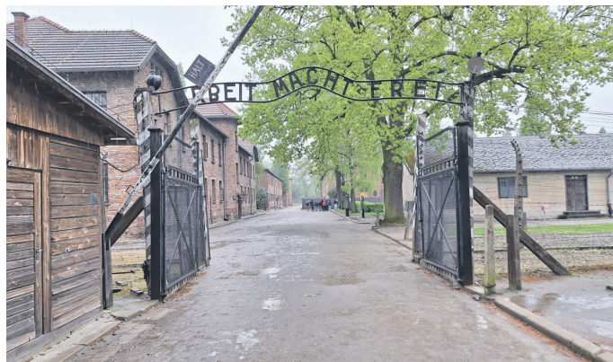
Eingangstor des Stammlagers Auschwitz

Die Erinnerung an die unzähligen Opfer, die hier ihr Leben lassen mussten, mahnt uns eindringlich, die Werte der Menschlichkeit, Toleranz und Gerechtigkeit zu bewahren und uns aktiv gegen jede Form von Diskriminierung und Hass einzusetzen. Auschwitz-Birkenau dient nicht nur als Gedenkstätte, sondern auch als Mahnmal für die Notwendigkeit, sich für eine Welt einzusetzen, in der solche Gräueltaten niemals wieder geschehen dürfen.