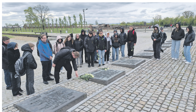
Blumenniederlegung in Auschwitz-Birkenau

Am Dienstag besuchten die Teilnehmer der Fahrt das ehemalige Vernichtungslager Auschwitz-Birkenau und erhielten an diesem authentischen Ort einen erschütternden Einblick in die schiere Dimension des Lagers. In Auschwitz-Birkenau wurden über 1,1 Millionen Menschen auf grausame Weise ermordet. Auch hier gedachten die Schülerinnen und Schüler der Opfer, indem sie symbolisch weiße Rosen niederlegten. Dieser Akt des Gedenkens diente dazu, die Erinnerung an die unzähligen unschuldigen Menschen wachzuhalten, die unter den barbarischen Machenschaften des nationalsozialistischen Regimes ihr Leben verloren hatten. Es war eine ergreifende Möglichkeit für die Teilnehmer, ihre Solidarität mit den Opfern zum Ausdruck zu bringen und ihre Entschlossenheit zu zeigen, sich für eine Welt einzusetzen, in der solche Gräueltaten nie wieder geschehen dürfen.