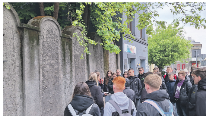
Mauer des ehemaligen jüdischen Ghettos in Krakau

Stadtführung. Während ihres Besuchs hörten die Schülerinnen und Schüler dort erschütternde Geschichten aus der Zeit der NS-Besatzung, die das Leben der jüdischen Gemeinschaft geprägt haben.