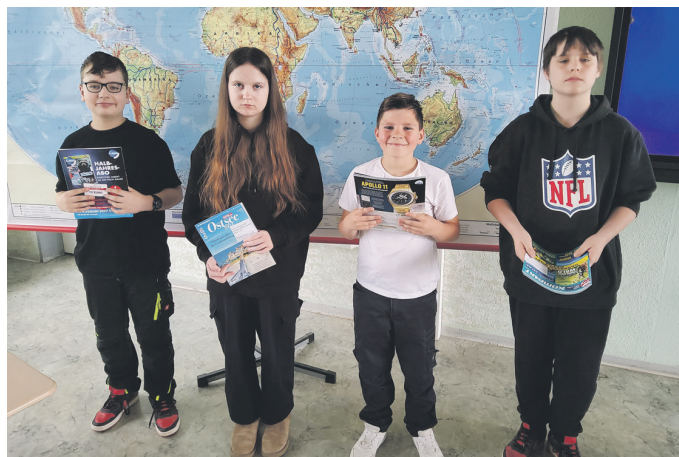
Sieger der Klassen 5 und 6

Nach einjähriger Pause konnten wir an der Regelschule Schloßvippach wieder am deutschlandweiten Geografie-Wettbewerb des Diercke Verlags teilnehmen. Sowohl bei den Junioren (Klasse 5 und 6) als auch bei den Schülern der Klasse 7 bis 10 wurden die besten Schülerinnen und Schüler ermittelt. Aufgaben rund um Deutschland, Europa, unsere Erde und die allgemeine Geografie galt es zu lösen.