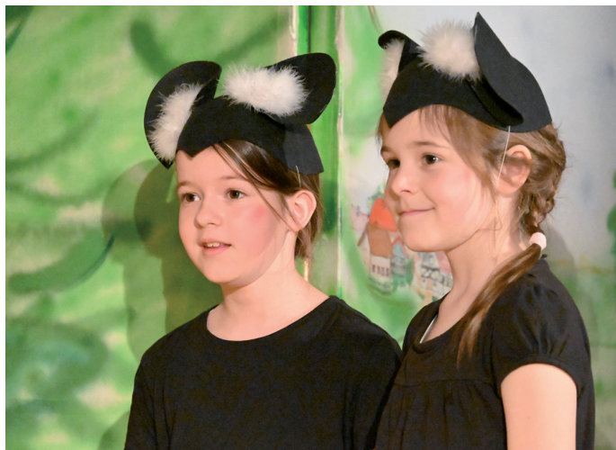
Die frechen Rennmäuse Meike und Mila sind stets für einen Spaß zu haben.

Heute nehmen die Kinder das Publikum mit in den Wald, den wir Menschen als friedlichen Ort kennen. Tiere und Pflanzen leben im Einklang miteinander. Außer dem Wind und dem Zwitschern der Vögel stört nichts die Ruhe im Wald. Doch weit gefehlt! Auf der Bühne ist rein gar nichts harmonisch.