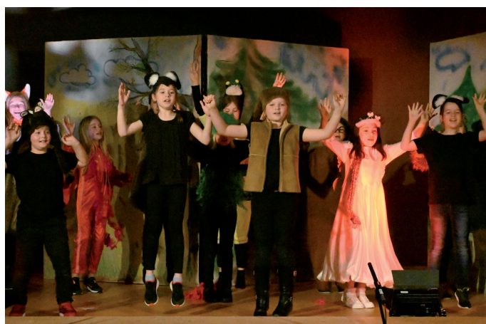
Gemeinsam stark: Mit einem Regentanz retten die Bewohner den Wald.

Aufgescheucht wuseln sie in der Garderobe durcheinander, der Eine sucht dies und das, der Andere kriegt seinen Reißverschluss nicht zu, der Nächste sitzt scheinbar tiefenentspannt in der Ecke. Doch 9.00 Uhr ist es geschafft: Alle Kinder haben sich in Waldbewohner verwandelt und sitzen im Kreis. Mit ein paar Aufwärmspielen stimmt sich die Gruppe auf den Auftritt ein.