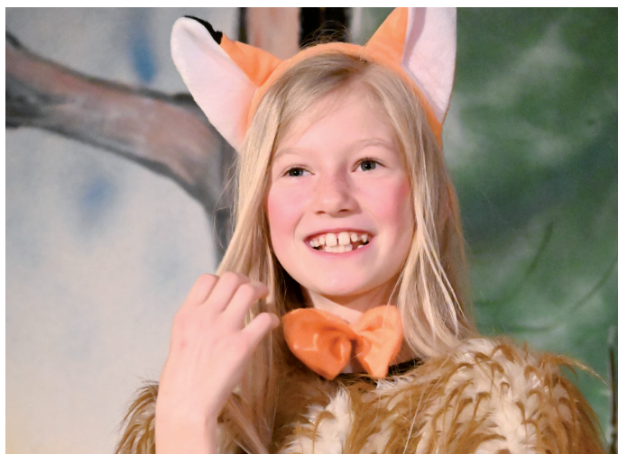
Die Spielfreude steht Füchsin Tessa ins Gesicht geschrieben.

Kurz vor Schluss wird das Geheimnis gelüftet: Oma Baum feiert Geburtstag und alle Tiere des Waldes sind als Gäste dabei. Doch selbst an der Geburtstagstafel fangen die Sticheleien wieder an. Nun hat Wildi, das Wildschweinkind noch eine Überraschung für Oma Baum: Ein Freudenfeuer! Das gutgemeinte Geschenk gerät schnell außer Kontrolle und der Wald brennt.