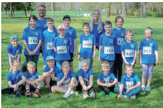
Erstmals in nigelnagelneuen blauen Trikots traten die SVL-Sportis beim diesjährigen Sömmerdaer Citylauf in Erscheinung.

Eine Woche zuvor hatte es beim 26. Sömmerdaer Citylauf noch nicht ganz zum Sprung auf das Podest gereicht, doch schon hier waren viele Plätze unter den ersten Zehn Ausdruck von noch schlummerndem Leistungsvermögen. Auch diesmal hatten sich die SVL-Sportis – so nennen sich die Mädchen und Jungen der Kindersportgruppe des SV Lossatal Großneuhausen – gut vorbereitet.