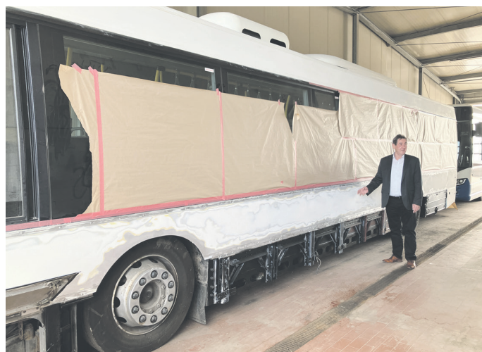
Bereits vorbereitet: Dieser abgeschliffene Bus wird als erstes Fahrzeug in der neuen Kabine lackiert.