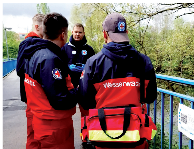
Die Männermannschaft beim Erste Hilfe-Parcours.