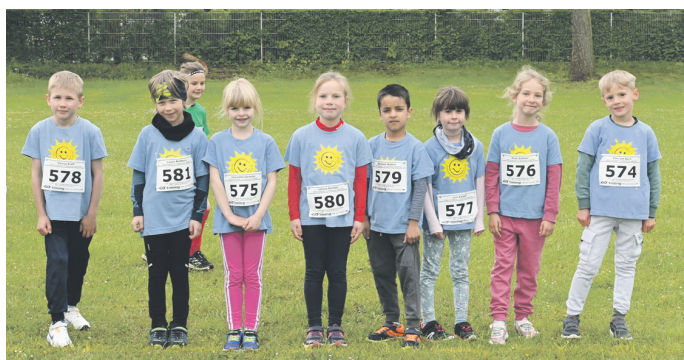
Eine starke Mannschaft: Unsere Jüngsten kurz vorm Start

Während beim Schulcross in der Woche zuvor noch frühlingshafte Temperaturen herrschten, waren diese inzwischen stark gefallen und so war es ein Crosslauf mit winterlichem Flair. Rund 900 Starter gingen an diesem Tag auf Rundkurs. Sechszwanzig Schulen schickten ihre besten Läuferinnen und Läufer zum größten Laufereignis im Landkreis Sömmerda.