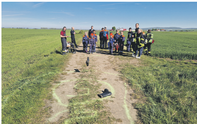
Die Floriansjünger waren auch beim Stiefelweitwurf gefordert.

Da die jüngeren Teilnehmer im Alter von sechs bis neun Jahren gleichberechtigt bewertet werden, müssen feuerwehrtechnische Übungen an diese Altersklasse angepasst werden. Je nach Durchschnittsalter der Starter gab es bei den Übungen Zeitzuschläge bzw. Bonuspunkte. Schlussendlich sammelte die Mannschaft Markvippach die meisten Punkte und nahm somit der Jugendfeuerwehr Köllda den Wanderpokal ab.