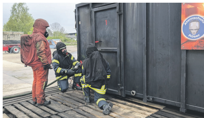
Kameradinnen und Kameraden üben Techniken zum richtigen Tür-Öffnen.

Dabei wurden alle Lehrgangsteilnehmer am Freitag einer theoretischen Schulung unterzogen, sodass am Samstag und Sonntag jeweils 30 Teilnehmer in der Zeit von 8.30 bis 18.30 Uhr den praktischen Einsatz durchführen konnten.