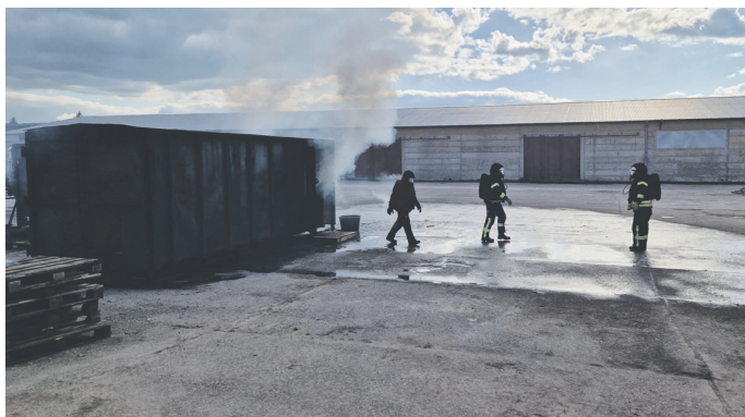
Realistische Heißausbildung bei Nullsicht für die Kameradinnen und Kameraden

Die Teilnehmer erlernten die Vorgehensweise beim Innenangriff mit dem Schwerpunkt der Brandbekämpfung. Unter realistischen Einsatzbedingungen wurden der Umgang mit Hohlstrahlrohren, die sichere Vorgehensweise beim Innenangriff, das richtige Öffnen von „heißen Türen“ und die Wirkung von richtiger und falscher Löschtaktik bei der Brandbekämpfung vertieft.