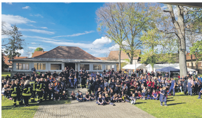
Gespanntes Warten auf die Siegerehrung

Pünktlich um 17.00 Uhr konnte die Siegerehrung durchgeführt werden. Bevor jedoch die Ergebnisse verkündet wurden, gab es für Landrat Harald Henning noch eine Überraschung: Ihm wurde als besondere Auszeichnung die Ehrenmedaille des Thüringer Feuerwehrverbands in Gold überreicht.