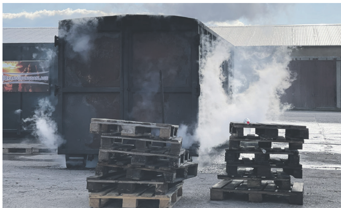
Mobile Brandübungsanlage während der Übung

Die Teilnehmer erlernten die Vorgehensweise beim Innenangriff mit dem Schwerpunkt der Brandbekämpfung. Unter realistischen Einsatzbedingungen wurden der Umgang mit Hohlstrahlrohren, die sichere Vorgehensweise beim Innenangriff, das richtige Öffnen von „heißen Türen“ und die Wirkung von richtiger und falscher Löschtaktik bei der Brandbekämpfung vertieft.