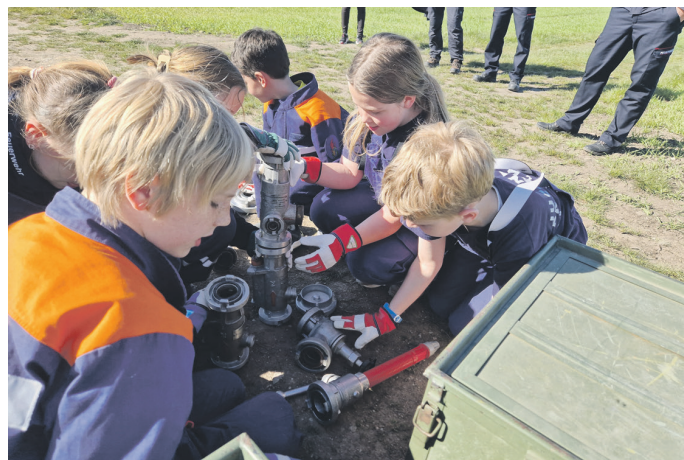
Bei den verschiedenen Aufgaben war neben Wissen und Geschicklichkeit auch Teamgeist gefragt.

jede Jugendfeuerwehr aus dem Landkreis ging an den Start. Phänomenale 50 Mannschaften mit insgesamt 507 Kindern und Jugendlichen begleitet von 131 Betreuern nahmen am Geländespiel teil. Pünktlich 8.00 Uhr begab sich die erste Mannschaft auf die knapp 5,5 Km lange Strecke. Der Zeitplan war eng gelegt, sodass im Fünf-Minutentakt die Mannschaften gestartet sind. Um 12.15 Uhr begab sich Ollendorf als letzte Mannschaft auf den Weg.