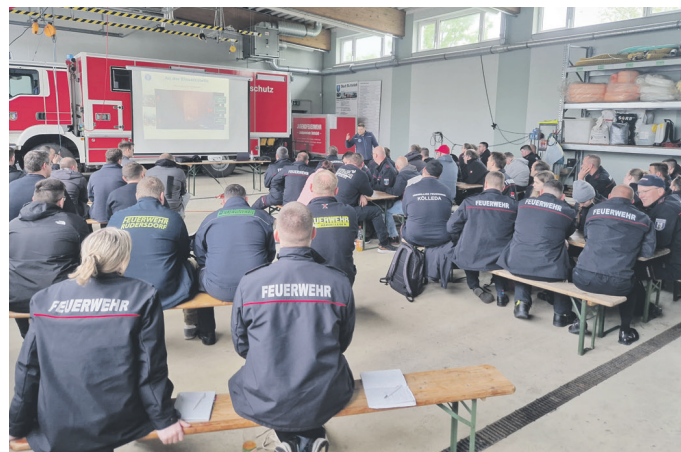
Am Freitag wurden alle Lehrgangsteilnehmer einer theoretischen Schulung unterzogen.

Für 60 der insgesamt 589 Atemschutzgeräteträger im Landkreis Sömmerda fand am Wochenende vom 19. bis 21. April 2024 erneut eine realistische Heißausbildung bei Nullsicht in einer mobilen Brandcontaineranlage statt. Die Teilnehmer wurden dabei an ihre physischen und psychischen Belastungsgrenzen herangeführt, um sie für kommende Einsätze gut vorzubereiten.