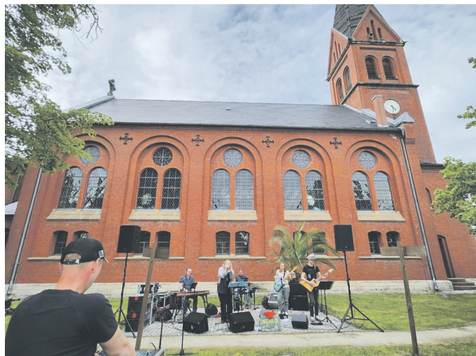
Die Band „Birdhouse“ begeisterte mit Coversongs und eigenen Stücken vor der schönen Kulisse der Ringlebener Kirche St. Bartholomäus.

Die Band „Birdhouse“ sorgte für die musikalische Unterhaltung beim ersten Frühlingsfest in Ringleben. Ihr Programm bot eine ausgewogene Mischung aus Pop und Rock der 1980er bis 2000er Jahre sowie eigenen Liedern. Die Live-Premiere des Titels „Was zählt“ betonte die Wichtigkeit des Zusammenhalts und das Streben nach Frieden.