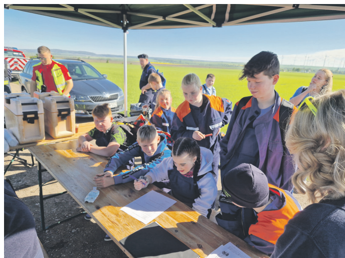
Eine der Stationen war der Wissenstest.

Dabei mussten an zwölf Stationen unterschiedliche Aufgaben abgearbeitet werden. Gefragt waren Teamgeist, Koordination und Geschwindigkeit beim Büchsenwerfen, Feuerwehrhindernislauf, dem Anziehen von Helm und Handschuhen sowie dem Anlegen von Knoten. Konzentration und Präzision waren beim Kuppeln von Armaturen, dem Flechten von Schläuchen zu einem Zopf oder dem Transport mittels einer Krankentrage gefragt. Ebenso galt es, schnellstmöglich Wasser mit „Limbo-Bewegungen“ zu transportieren. Ferner mussten Fragen aus dem Feuerwehrbereich und dem Allgemeinwissen beantwortet werden.