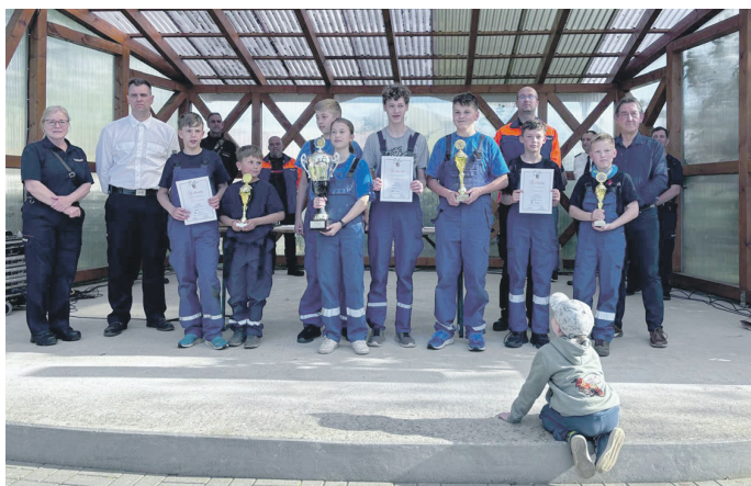
Die strahlenden Sieger des 25. Geländespiels

Da die jüngeren Teilnehmer im Alter von sechs bis neun Jahren gleichberechtigt bewertet werden, müssen feuerwehrtechnische Übungen an diese Altersklasse angepasst werden. Je nach Durchschnittsalter der Starter gab es bei den Übungen Zeitzuschläge bzw. Bonuspunkte. Schlussendlich sammelte die Mannschaft Markvippach die meisten Punkte und nahm somit der Jugendfeuerwehr Köllda den Wanderpokal ab.