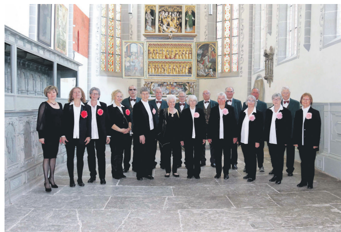
Frühlingskonzert des Männergesangsvereins Sömmerda in der Stadtkirche St. Peter und Paul in Weißensee.

Die Franziskuskirche in Sömmerda am 28. April 2024 und die Stadtkirche St. Peter und Paul in Weißensee am 5. Mai 2024 waren die beiden Stationen unserer Frühlingskonzerte. Während das Konzert in der Franziskuskirche vom Gemischten Chor bestritten wurde, hatten wir in Weißensee „Verstärkung“ eingeladen.