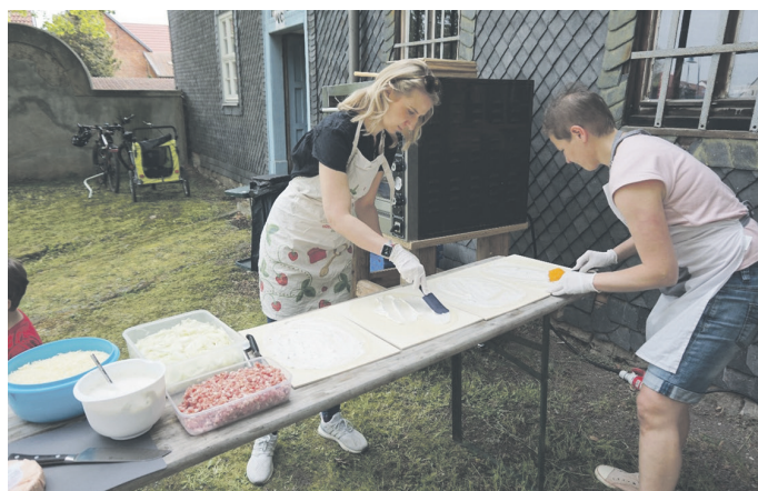
Die frisch gebackenen Flammkuchen waren sehr begehrt.

Doch auch die ernstesten Themen unserer Zeit haben ihren Raum bekommen. Neben dem Aufruf, sich vor Ort zu engagieren und sich wieder mehr zuzuhören, wurde auch der Appell an die Gäste gerichtet, ihre Stimme bei den kommenden Wahlen demokratisch abzugeben und sich dabei nicht von einfachen Parolen und Hetze leiten zu lassen! Gemeinsam Zusammen Wachsen, das heißt auch, vielfältigen Meinungen und Bedürfnissen mit Respekt zu begegnen und eigene Menschlichkeit zu bewahren.