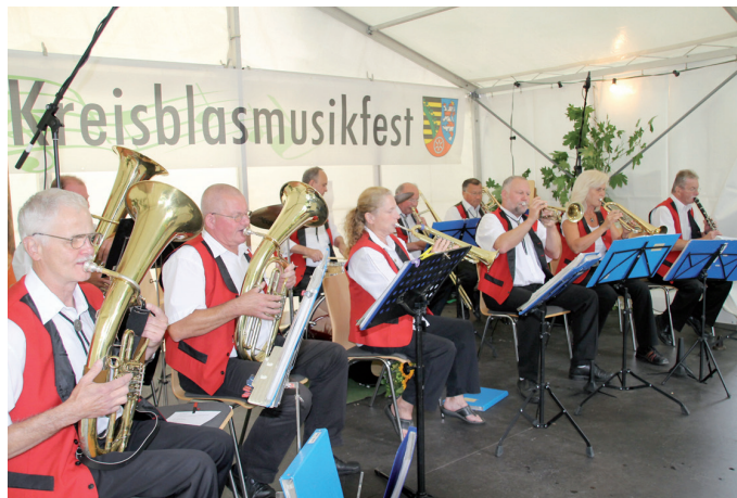
Die Nödaer Blasmusikanten waren zuletzt 2014 Gastgeber des 45. Kreisblasmusikfestes in Nöda.

Landrat Harald Henning und die Nödaer Blasmusikanten laden in diesem Jahr zum Kreisblasmusikfest und zum 75-jährigen Jubiläum der Kapelle nach Nöda ein.