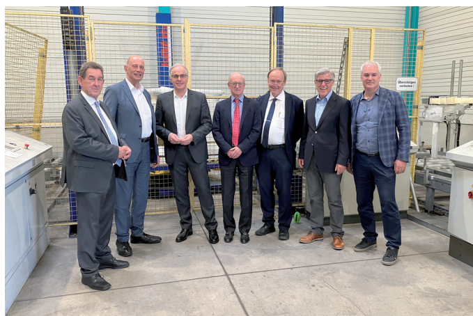
Inhaber und Geschäftsführung mit den Ehrengästen beim Rundgang durchs Unternehmen.

Vor dem Rundgang durch das imposante Werksgebäude, in das bereits eine moderne Anlage zur Herstellung von Kunststoffumreifungsbändern aus recyceltem PET und eine Zerkleinerungsanlage für Produktionsausschuss, aus dem sofort wieder der Rohstoff für neue Bänder entsteht, Einzug gehalten haben, hoben Bauherren und Gäste die Bedeutung der 14,5 Millionen Euro-Investition hervor.