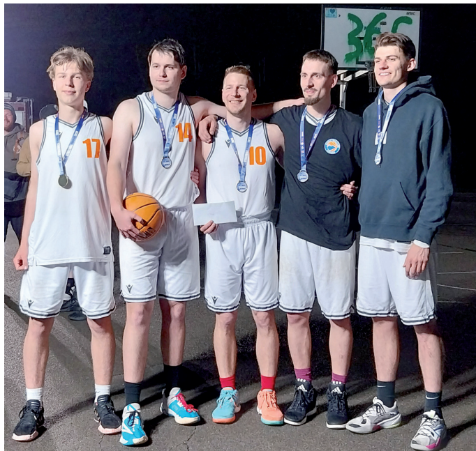
Das Gewinnerteam der Altersklasse 17+ waren die „Coburger Jungs“

Der ASB Kreisverband Sömmerda e.V. veranstaltete am 23. Mai 2025 zusammen mit dem Kreissportbund Sömmerda e.V. und dem Run4Kids Sömmerda e.V. sowie dem Landkreis Sömmerda und der Stadt Sömmerda das beliebte „Night-Streetball-Turnier“. Austragungsort war trotz zahlreicher Regenschauer der Skateplatz/Diesterwegsportplatz im Stadtteil „Neue Zeit“.