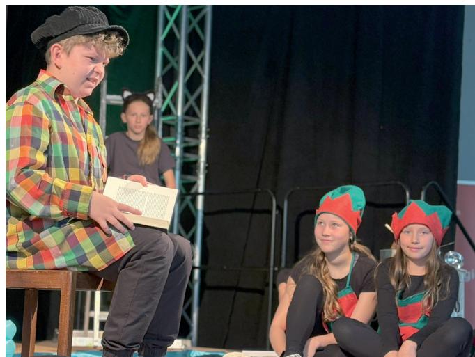
Die Theatergruppe der Salzmann-Regelschule Sömmerda brachte den „Zauberlehrling“ auf die Bühne.

Vorteil des neuen Systems: Keine Gruppe hatte Leerlauf. Während die einen auf der Bühne spielten, tauschten sich die anderen in den Beratungen aus oder vertieften ihr Wissen in den Workshops.