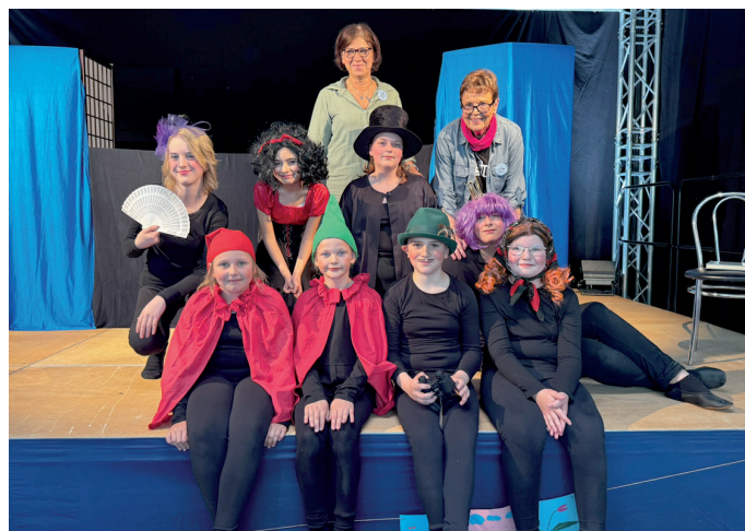
Die jungen Mimen des Schüler-Freizeit-Zentrums Sömmerda überzeugten mit ihrer Version von „Schneewittchen“.