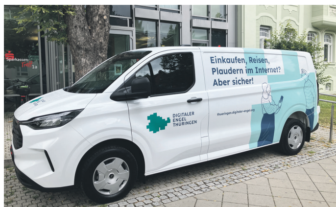
Gut sichtbar: Um über digitale Themen ins Gespräch zu kommen, machen die „digitalen Engel“ mit ihrem Infomobil Station auf Märkten oder Veranstaltungen.

Online-Banking, Shoppen im Internet, Reiseplanung vom Sofa aus oder das Texten über Kurznachrichtendienste: Was für jüngere Menschen längst zum Alltag gehört und oft intuitiv innerhalb weniger Klicks erledigt ist, ruft bei Seniorinnen und Senioren hingegen in vielen Fällen Unsicherheit hervor. Ältere Menschen fit zu machen und ihnen Schlüsselkompetenzen für digitale Medien zu vermitteln, hat sich das Projekt „Digitaler Engel Thüringen“ zur Aufgabe gemacht.