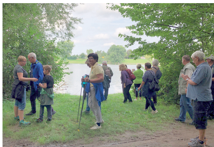
2023 führte der Familienwandertag die Wanderfreunde in die Landgemeinde Buttstädt, an den Stausee von Großbrennbach.

Bereits zum 10. Mal dürfen die Wanderschuhe geschnürt werden, denn auch in diesem Jahr lädt der Landkreis Sömmerda wieder zu einer Wanderung durch die Heimat ein.