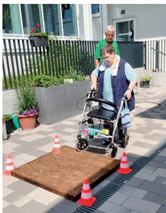
Rollator-Training mit der Verkehrswacht

Seit März 2022 fühlen sich hier die Seniorinnen und Senioren wohl und geborgen und sind in der Gemeinschaft wie zu einer kleinen Familie zusammengewachsen. Auch neue Bewohnerinnen und Bewohner werden herzlich aufgenommen. Viele Aktivitäten, wie z.B. das Sommerfest oder ein Rollator-Training, finden großen Anklang und rege Beteiligung. Für die Familien ist es beruhigend zu wissen, dass ihre Angehörigen hier ihren „Herbst des Lebens“ in Gesellschaft miteinander genießen können.