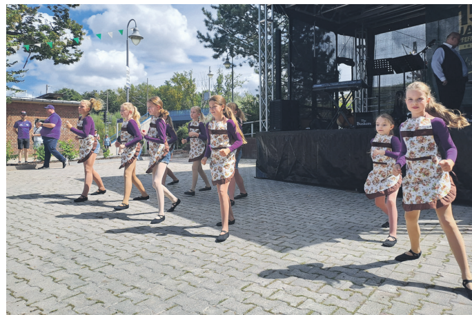
Die Kindertanzgruppe des Purple Diamonds Erfurt e.V. erfreute mit Tanzeinlagen die Zuschauer.

Neben dem Dampfsonderzug verkehrten zum Bahnhofsfest auch Sonder- und Zusatzzüge der Erfurter Bahn auf dem Streckenabschnitt der Pfefferminzbahn von Straußfurt bis Großheringen. Eine Sonderfahrt der „Wipperliese“ der Mansfelder Bergwerksbahn stand ebenfalls auf dem Programm.