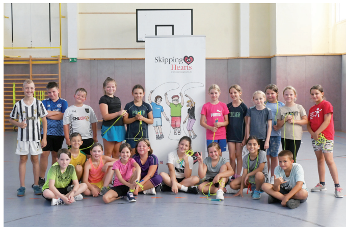
Geschafft, aber begeistert: Auch wenn es sehr warm war, sind sich die Kinder einig, dass Rope Skipping viel Spaß macht.

Die Kinder gaben alles bei den hochsommerlichen Temperaturen: Mit zahlreichen Trinkpausen und der Verlegung der Paarsprünge in den Schatten des Schulhofes ließ es sich aushalten.