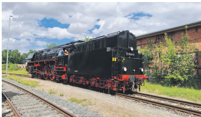
Der Sonderzug aus Sonneberg konnte im Sömmerdaer Bahnhof beim Wasserfassen begutachtet werden.

Ein beliebtes Fotomotiv zum Bahnhofsfest am 17. August war die Dampflok der Sonneberger Eisenbahnfreunde, die am frühen Nachmittag weithin sicht- und hörbar zahlreiche Fahrgäste zum 150-jährigen Jubiläum der Pfefferminzbahn nach Sömmerda brachte.