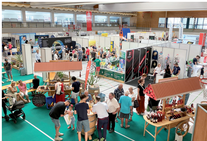
Am traditionellen Standort, der Unstruthalle, hatte die neue SÖM ihre Pforten geöffnet.

Der Mut, die Organisation in die eigenen Hände zu nehmen, sollte belohnt werden. Die mehr als 50 Aussteller zeigten sich zufrieden mit der guten Resonanz an beiden Messetagen. Bei den Besuchern schien das neue Messe-Konzept ins Schwarze getroffen zu haben: Deutlicher als früher konzentrierte sich die SÖM auf die Interessen der Verbraucher.