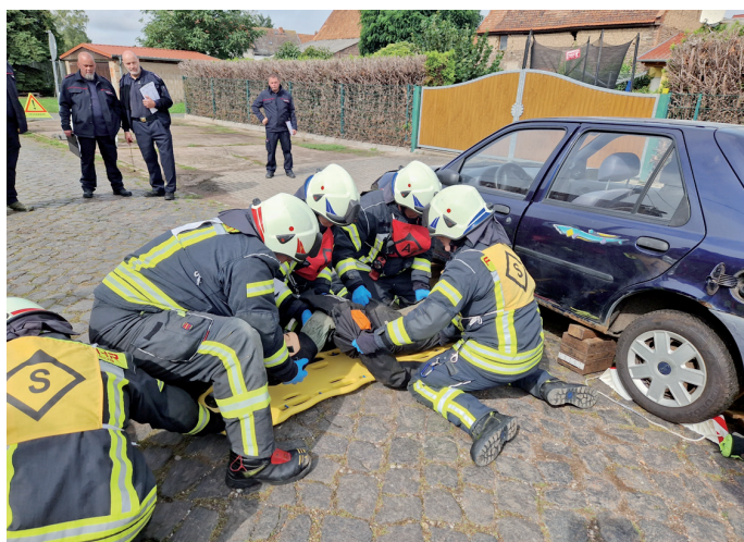
Die Mannschaft der Freiwilligen Feuerwehr Kölleda im Einsatz: Sie siegte in der Kategorie „Löschgruppenfahrzeug“.

16 Wertungsrichter, Übungsbeobachter und Zeitnehmer bewerten die einzelnen Abschnitte der Übungen (Meldestelle, Lagebewertung, Rettung der Person, Sicherung der Einsatzstelle, Bereitstellung der Technik, Unfallverhütung, etc.) entsprechend der vom Landkreis vorgegeben Wettbewerbsordnung von 2023. Dabei musste ein Hilfeleistungseinsatz (Verkehrsunfall) abgearbeitet werden. Das Szenario: Ein PKW-Fahrer hat eine die Straße überquerende Person übersehen und hierbei überfahren, sodass die Person unter dem Fahrzeug eingeklemmt ist.