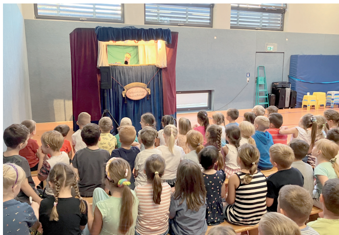
Die Puppenbühne „Susanne Böhmel“ aus Dresden wies die Kinder mit ihrem Programm „Fangt die Hexe Wackelzahn“ mit Spaß auf die Bedeutung einer guten Zahngesundheit hin.

Das sehen auch die Organisatoren des jährlich bundesweit stattfindenden Tages der Zahngesundheit so. Er möchte Kinder motivieren, Verantwortung für ihre Gesundheit zu übernehmen, vor allem indem er sie über zahnmedizinische Zusammenhänge aufklärt. Unter dem Motto „Gesunde Zähne – gesunder Körper“ veranstaltete der Jugendzahnärztliche Dienst im Landratsamt am 6. September 2023 einen Aktionstag zur Stärkung der Zahngesundheit in der Grundschule Haßleben. Für rund 150 Kinder drehte sich an diesem Vormittag alles um Mundhygiene und gesundheitliche Prävention.