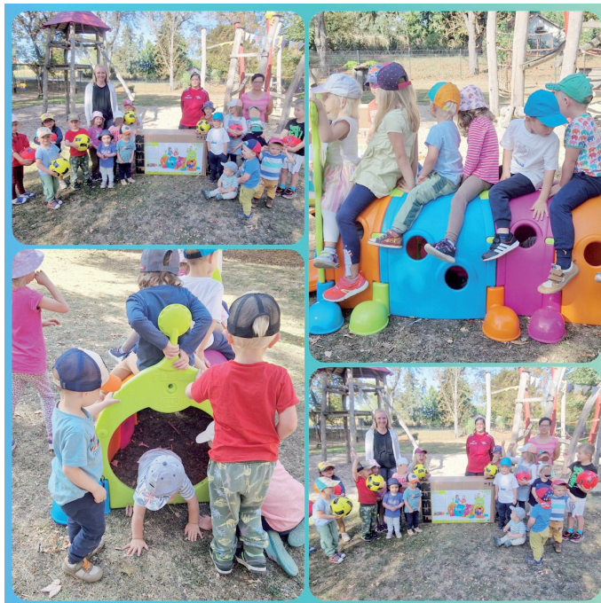
Die Kinder und Erzieherinnen vom Kinderland Ringleben