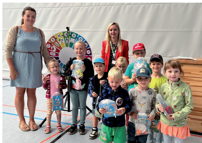
Die Beichlinger Waldstrolche sind stolz auf Ihren Gewinn beim Glücksrad – ein Zahnputzset, bestehend aus Zahnpasta, Zahnbürste und Zahnputzbecher.