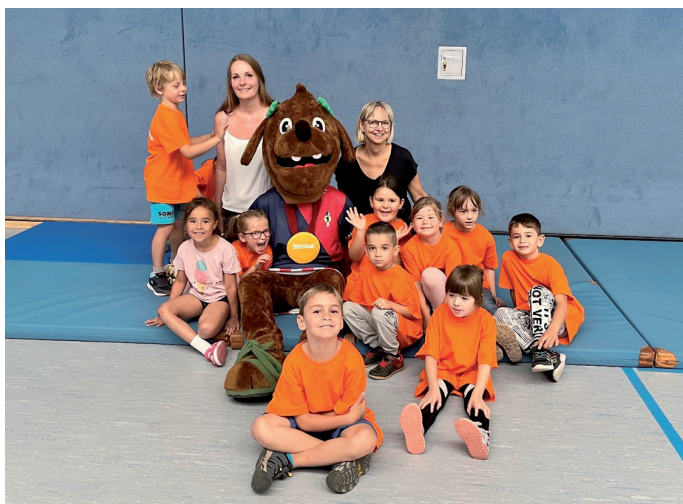
Die Kölledaer Feistkörner haben Spaß mit Sportikus.

Das Puppentheater Böhmel aus Dresden hat für die Kinder das Stück „Fangt die Hexe Wackelzahn“ aufgeführt, hier konnten die Kinder gespannt den Kampf von Putzi gegen die bonbonwerfende Karies-Hexe verfolgen und sehen- das Gute siegt immer am Ende. Und wenn es noch nicht gut ist, ist es noch nicht das Ende.