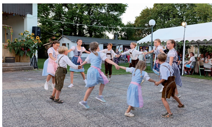
Die Jüngsten vom Faschingsclub Tunzenhausen