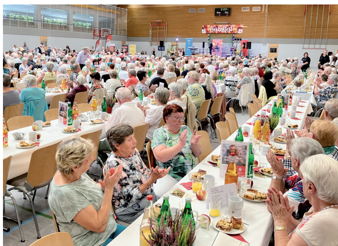
Zahlreiche Gäste feierten am 6. September 2025 das Herbstfest der Generationen in der Unstruthalle.