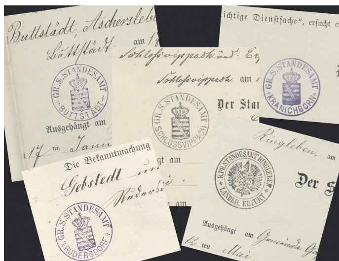
Siegel aus verschiedenen Standesämtern, Ende 19. Jh.

Nicht jede Gemeinde erhielt ein eigenständiges Standesamt. In diesen Fällen mussten die Bewohner sich in den Nachbarort begeben, um eine Geburt, einen Todesfall oder eine Eheschließung bei dem Standesbeamten anzumelden. In den damals zum Großherzogtum Sachsen-Weimar-Eisenach gehörenden Orten des heutigen Landkreises Sömmerda kam es erst 1876 zur Errichtung von Standesämtern. Eine Übersicht zu den Zuständigkeiten der Standesämter und deren Veränderungen bis heute finden Sie auf dem Ahnenforschungsportal des Landkreises Sömmerda.