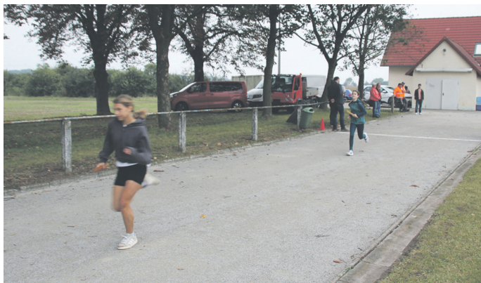
Mit Staffelläufen im Rahmen des Schulsportfests wurde die neue Laufbahn eingeweiht.

Reges Treiben herrschte am 19. September 2024 auf dem Sportplatz in Schloßvippach. Die Schülerinnen und Schüler der Regelschule hatten sich am Vormittag auf dem Gelände versammelt, um mit einem Sportfest die Einweihung der neuen 400m-Laufbahn gebührend zu feiern. Mit zehn verschiedenen Stationen wartete das Sportfest auf, gekrönt von einem Volleyballturnier zwischen Lehrern und Zehntklässlern. Die erste Feuerprobe für den neuen Belag der Laufbahn hingegen war der Staffellauf zwischen den Klassenstufen. Lautstark angefeuert von ihren Mitschülern, flogen die Läufer geradezu über die Bahn.