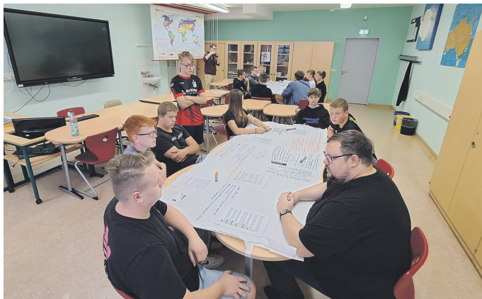
Rede und Antwort standen Politiker verschiedener Parteien zum Speed-Dating.

Am 10. September 2024 startete die Klasse mit dem Projekt „Ausgefragt? Nachgehakt! – Speed-Dating mit Politikerinnen und Politikern“, das in der Regelschule Weißensee stattfand. Bei diesem besonderen Event hatten die Schülerinnen und Schüler die Gelegenheit, mit Vertretern verschiedener politischer Parteien ins Gespräch zu kommen. Vertreter der FDP, Grünen, SPD und AfD waren anwesend, um mit den Jugendlichen über aktuelle politische Themen und Herausforderungen zu diskutieren.