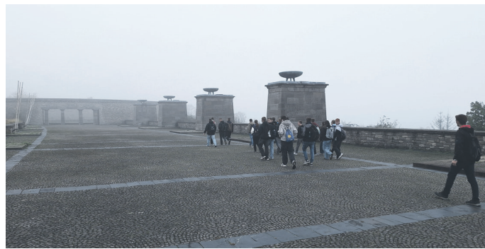
Exkursion zur Gedenkstätte Buchenwald

Den Abschluss der Projekttag bildete am 18. September 2024 eine Exkursion zur Gedenkstätte Buchenwald. Hier lernten die Schüler mehr über die dunkle Vergangenheit des ehemaligen Konzentrationslagers. Sie setzten sich mit der Geschichte des Nationalsozialismus, dem Schicksal der Häftlinge und den Verbrechen auseinander, die an diesem Ort begangen wurden. Die vertiefte Beschäftigung mit der Geschichte soll den Schülerinnen und Schülern bewusst machen, wie bedeutsam es ist, sich für eine demokratische und menschenwürdige Gesellschaft einzusetzen.