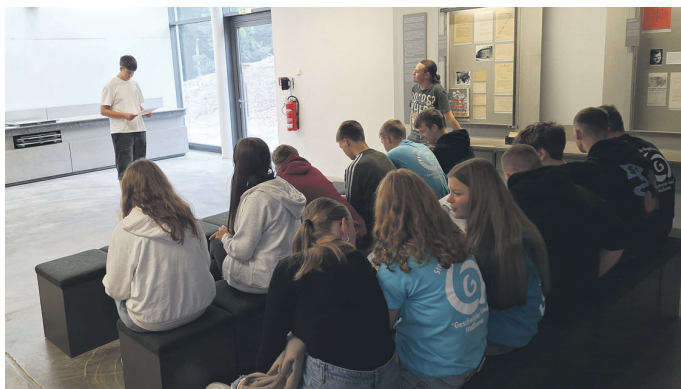
Eine Führung und zwei Workshops zum „Tag der Begegnung“ vertieften das Wissen um historische Ereignisse.

Weiter ging es am 13. September 2024 mit einem Projekttag im Rahmen der „Tage der Begegnung“, der sich der Aufarbeitung der Vergangenheit widmete. Dieser Tag stand im Zeichen der Erinnerung an das sowjetische Speziallager Nr. 2 in Buchenwald, welches von 1945 bis 1950 auf dem Gelände des ehemaligen Konzentrationslagers von der Sowjetunion betrieben wurde.