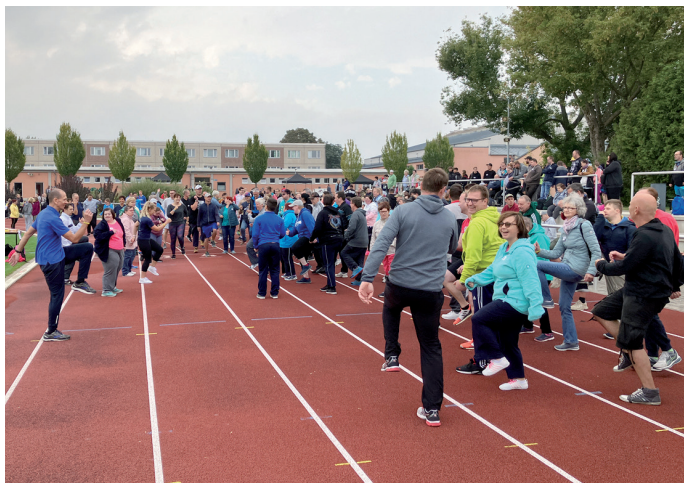
Bevor sich die Teilnehmer an die einzelnen Stationen, wie z.B. Weitsprung, Zielwurf oder Sprint, begeben durften, gab es wieder eine gemeinsame Erwärmung, die allen sichtlich Freude bereitete.