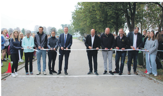
Mit dem feierlichen Banddurchschnitt ist die neue 400m-Laufbahn offiziell für den Sportbetrieb freigegeben.

Von August bis September 2024 hatte die Schloßvippacher Firma Aust EKS Bau die Laufbahn erneuert und eine neue wasserdurchlässige Schicht sowie eine Deckschicht aufgetragen, die sowohl Standfestigkeit als auch Funktion der Laufbahn gewährleisten soll.