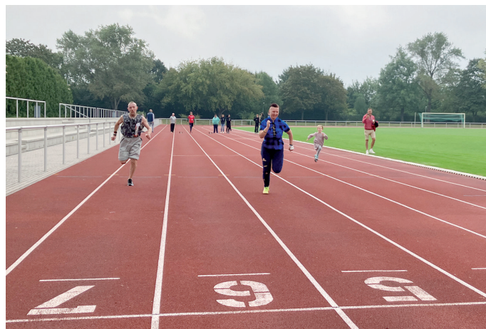
Ob beim Sprint oder den anderen Disziplinen – alle Teilnehmer gingen mit großer Motivation und Spaß an den Start.

Das Inklusive Sportfest ist ein Gemeinschaftsprojekt der Stiftung Finneck, des Kreissportbunds Sömmerda, Special Olympics Thüringen, des Thüringer Behinderten- und Rehabilitations-Sportverbands sowie der Gymnasien Sömmerda und Kölleda. Darüber hinaus haben die Sparkasse Mittelthüringen, die Partnerschaft für Demokratie im Landkreis Sömmerda und die AOK das besondere Angebot unterstützt.