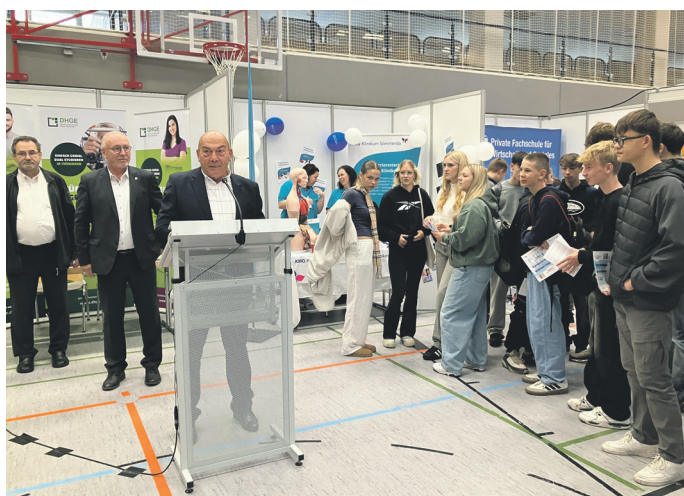
Der 1. Kreisbeigeordnete Heiko Koch eröffnete gemeinsam mit Sömmerdas Bürgermeister Ralf Hauboldt die 28. Berufsinfobörse.

Beide Politiker betonten, wie wichtig eine frühzeitige Beschäftigung mit den zahlreichen Ausbildungsmöglichkeiten für den eigenen Lebenslauf ist. Sie dankten zudem den vielen Partnern, die dies den Jungen und Mädchen im Rahmen der BIB auf unkomplizierte Weise ermöglichen.