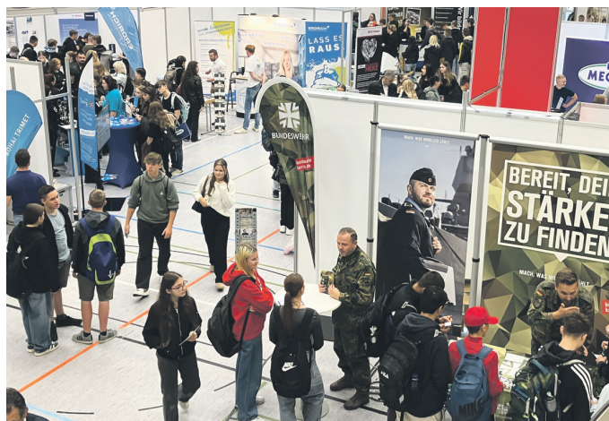
Mehr als 60 Aussteller warben in der Unstruthalle um junge Nachwuchskräfte, u.a. auch zahlreiche Landesbehörden oder die Bundeswehr.

Emsiges Treiben herrschte am 26. September in der Unstruthalle in Sömmerda: Landkreis und Stadt hatten zur jährlichen Ausbildungsmesse eingeladen und zahlreiche Schulen der Region waren dem Aufruf gefolgt. Bereits zur offiziellen Eröffnung gegen 9.00 Uhr war der Andrang bei den Ausstellern groß.