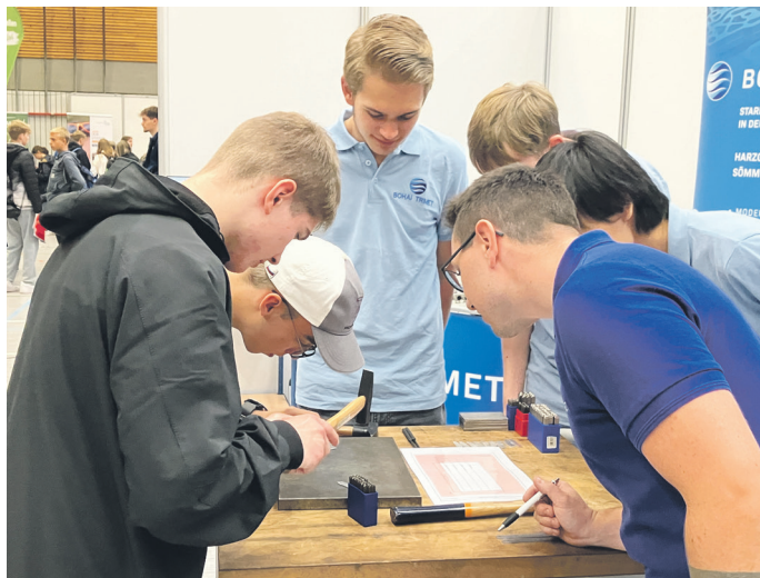
Augenmaß und Fingerfertigkeit bewiesen diese jungen Männer bei der Bohai Trimet Automotive Holding aus Sömmerda.