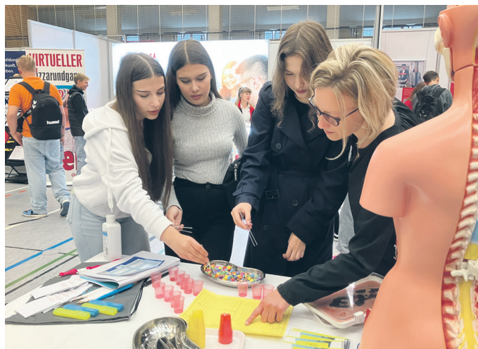
Bei der Freien Beruflichen Schule für Therapie, Pädagogik und Pflege Heldrungen wurden Medikamentenpläne studiert und die Tabletten entsprechend dosiert.

Die Aussteller der 28. BIB hatten sich einiges einfallen lassen, um die Aufmerksamkeit der jungen Nachwuchskräfte auf sich zu lenken. Bei der Freien Beruflichen Schule für Therapie, Pädagogik und Pflege Heldrungen wurden beispielsweise Medikamentenpläne studiert und die Tabletten entsprechend dosiert, bei der Firma Bohai Trimet Automotive aus Sömmerda waren Augenmaß und Fingerfertigkeit gefragt, während das Unternehmen Ospelt mittels Virtual Reality in den Produktionsprozess einer Pizza entführte.