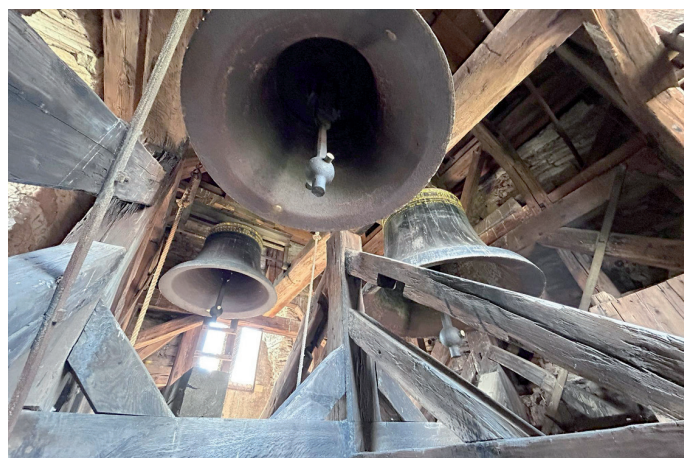
Die drei Klangstahlglocken

Nach langwierigen Verhandlungen entschied sich die Kirchengemeinde 1925 für ein neues Geläut aus Klangstahl – gegossen von der Firma Schilling & Lattermann in Apolda. Die drei neuen Glocken mit einem Gesamtgewicht von 2821 kg erklingen seither im E-Dur-Dreiklang und jede Glocke mit einer entsprechenden Aufschrift: „Ehre sei Gott in der Höhe“ + Bürgermeister und Gemeinderat – „Friede auf Erden“ + Kirchenvorstand und Kirchenvertretung – „den Menschen ein Wohlgefallen“ und prägen seit 100 Jahren das klangliche Bild unseres Dorfes.