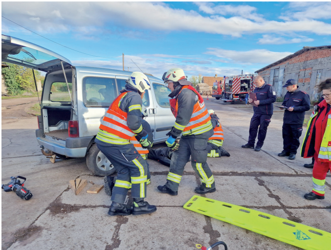
Die Mannschaft der FF Backleben im Einsatz.

Am 21. Oktober 2023 wurde die Kreismeisterschaft in der Disziplin Einsatzübung Hilfeleistung in Alperstedt durchgeführt. Wettkampfbeginn war um 9.00 Uhr am Sportplatz in der Helmut-Mataré-Allee, wobei die Vorbereitungen für die Verpflegung bereits seit den frühen Morgenstunden liefen.