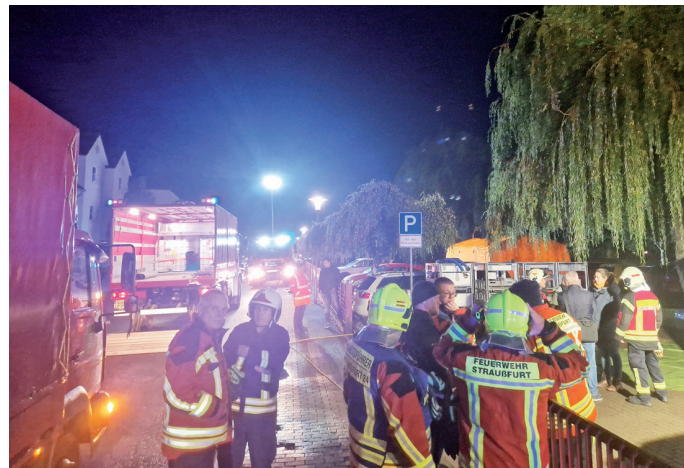
Die Einsatzkräfte neben der Dekontaminationsstrecke und dem Vorbereitungszelt für die Einsatztrupps.

Die kontaminierten Personen verblieben im Objekt. Mit diesen wurde ein telefonischer Kontakt hergestellt. Währenddessen wurde eine Notdekontamination aufgebaut, bis der Gefahrgutzug einsatzfähig war.