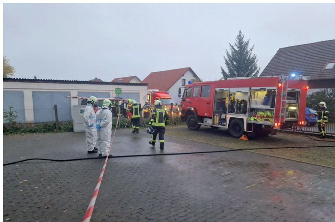
Einsatzkräfte der FF Buttstädt im Absperrbereich in Vorbereitung zur Lageerkundung im Objekt.

Daraufhin alarmierte die Leitstelle Erfurt die örtliche Feuerwehr Buttstädt nebst den Anrainern Rudersdorf und Rastenberg sowie den Gefahrgutzug des Landkreises Sömmerda (FF Elxleben, FF Großrudestedt, FF Kindelbrück, FF Kölleda, FF Sömmerda, FF Straußfurt, FF Weißensee).