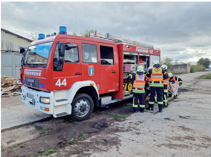
Die Mannschaft der FF Gebesee bei der Entnahme der Gerätschaften aus dem Löschgruppenfahrzeug.

An der Kreismeisterschaft nahmen die Sieger der Stützpunktbereichsausscheidung in den Kategorien „Löschgruppenfahrzeug“ und „Kleinlöschfahrzeug“ teil. Alle gemeldeten Mannschaften hatten ihre Teilnahme bestätigt. Diese kamen aus den Freiwilligen Feuerwehren Weißensee, Kölleda und Gebesee für die Löschgruppenfahrzeuge (LF) sowie Großmölsen, Ringleben und Backleben für die Kleinlöschfahrzeuge (KLF).