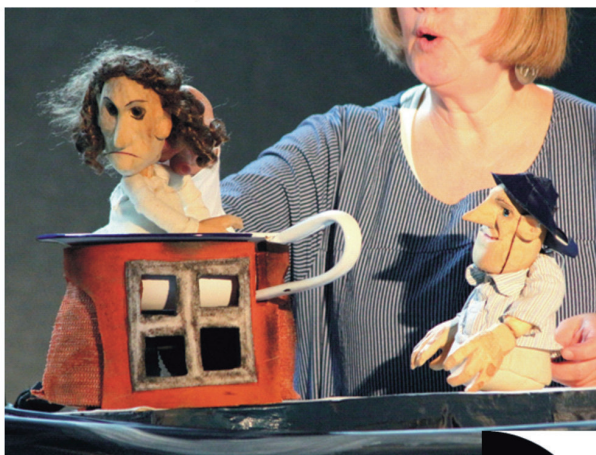
Dramaturgische Begleitung: Monika Bohne, Falk P. Ulke Ausstattung: Falk P. Ulke, Antje Willems-Schünemann Text und Spiel: Antje Willems-Schünemann

„In so einem Pisspott ist es eng, dunkel und es stinkt und man hat einfach immer Hunger. Grund genug, sich ein besseres Leben zu wünschen, Wenigstens ein bisschen... oder doch etwas mehr? Und da taucht plötzlich auch noch ein Zauberfisch auf...“