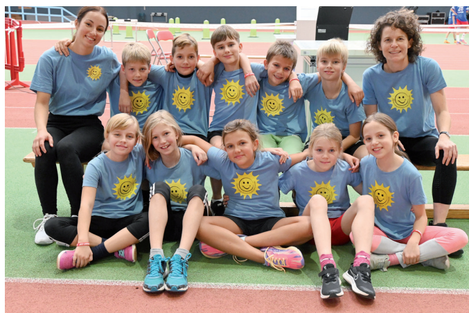
Eine starke Diesterwegmannschaft

Bereits zum dritten Mal vertraten wir am 26. Oktober 2023 den Schulamtsbereich Mittelthüringen beim Sprintcup in der Erfurter Leichtathletikhalle. Nur vier Schulen aus jedem Schulamtsbereich (Nord, Ost, Süd, West und Mitte) durften nach Erfurt reisen. Durch den Gewinn des Leichtathletikpokals im vergangenen Schuljahr wurde uns diese Ehre zuteil.