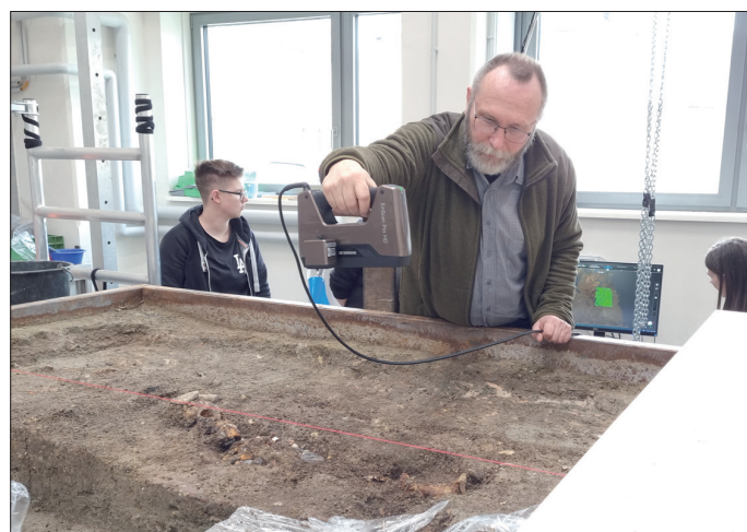
Jede freigelegte Schicht der Grabkammer wurde mit einem Handscanner erfasst und dokumentiert.

Zwischen 2017 und 2021 fanden im Gewerbegebiet Kölleda-Kiebitzhöhe auf einer Fläche von ca. 20 Hektar intensive archäologische Untersuchungen durch das Thüringische Landesamt für Denkmalpflege und Archäologie (TLDA) statt. Ausgegraben wurde ein Bestattungsplatz der Merowingerzeit (6./7. Jh. n. Chr.), auf dem besonders die Grabkammer einer Frau auffiel. Die Kammer wurde als Blockbergung mit 13 Tonnen Gewicht als Ganzes geborgen und in die Restaurierungswerkstätten nach Weimar gebracht, um dort unter Laborbedingungen freigelegt zu werden.