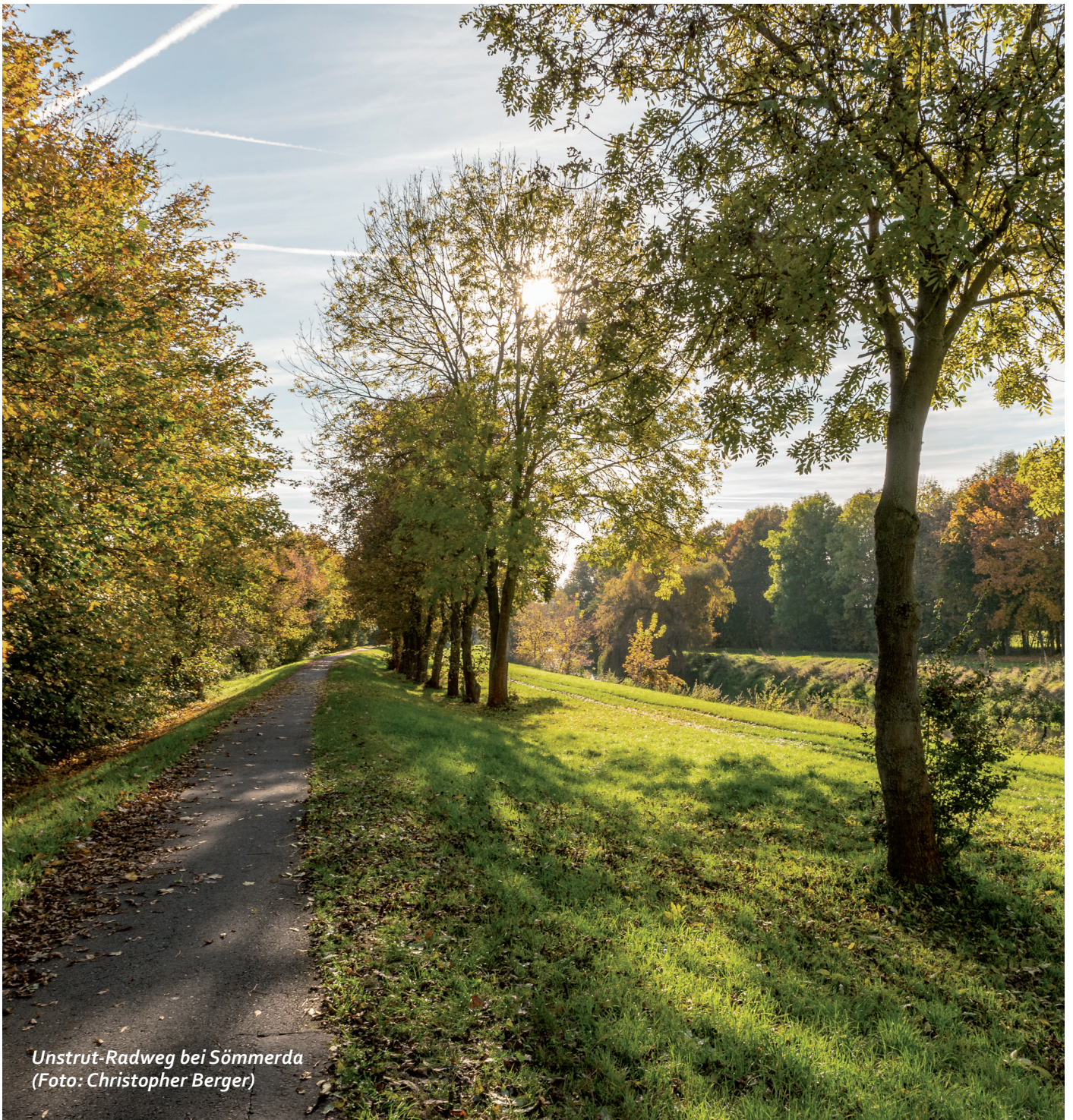
Unstrut-Radweg bei Sömmerda