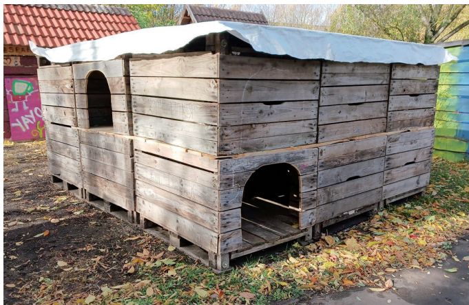
Kletterstrecke aus Obstkisten

Des Weiteren schult sie auf dem Bauspielplatz regelmäßig Kinder als Brandschutzhelfer:innen und für den Kindersanitätsdienst. Dabei kam auch in diesem Jahr das wunderbare Holzfeuerwehrauto Marke Eigenbau zum Einsatz.