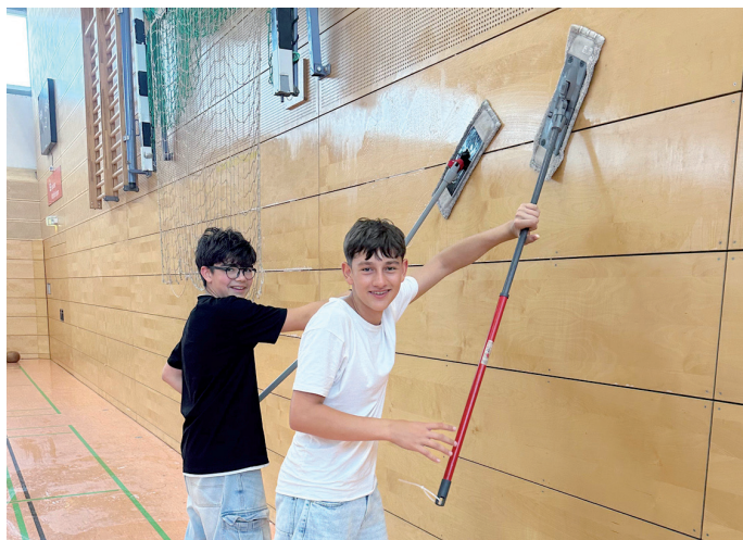
Die Mitglieder des HSV Sömmerda 05 beim Reinigen der Turnhalle der Staatlichen Gemeinschaftsschule „Albert Einstein“

Es trafen sich zahlreiche Vereinsmitglieder, Eltern und Unterstützerinnen und Unterstützer zum großen Hallenputztag in der Einsteinhalle. Der Hallenboden wurde sorgfältig gewischt und von hartnäckigen Harzflecken befreit, die Kabinen erhielten einen frischen Anstrich und wurden gründlich gereinigt. Auch Bänke, Türen und Wände wurden nicht vergessen – überall wurde geschrubbt, gestrichen und aufgeräumt.