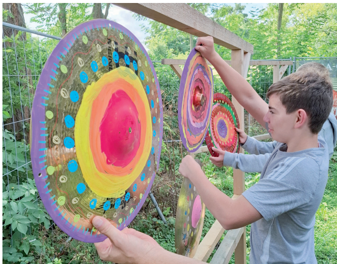
Klangpfad auf dem Bauspielplatz

Ein weiteres Highlight des Jahres war das Projekt „Escape – Rätsel dich durch den Bauspielplatz“ gefördert durch Kultur macht stark und den Spielmobile e.V. Im Projekt konnten Kinder ihr eigenes Rätselspiel bauen und gemeinsam nach Herzenslust knobeln, Schätze verstecken und witzige Geschichten entwickeln. Aber auch Musik spielte in diesem Jahr eine wichtige Rolle auf dem Bauspielplatz.