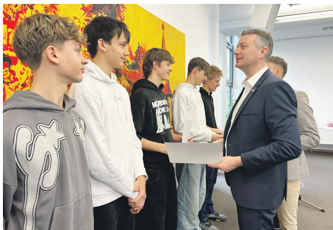
Die Basketballer des Albert-Schweitzer-Gymnasiums Sömmerda