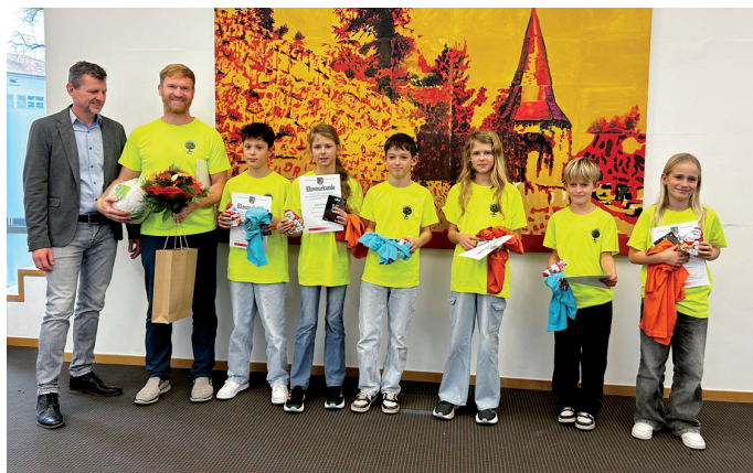
Die Crossläufer der Grundschule Weißensee

schätzung, Anerkennung, das Aufzeigen von Chancen und Wegen, so Seeber weiter. Glücklicherweise gäbe es im Landkreis diese Chancengeber, zu denen neben den Schulleitern, Lehrern und Fachschaftsleitern auch das Landratsamt, der Kreissportbund und die Sparkasse Mittelthüringen zählen. „Sie alle ermöglichen mit ihrem Tun erst diese sportlichen Höchstleistungen und auch, dass wir diese in einem solch feierlichen Rahmen würdigen können“, hob der Fachberater hervor.